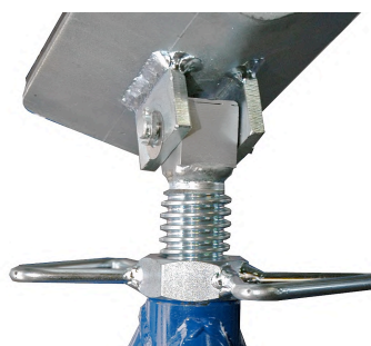
Detail der Spindelverstellung